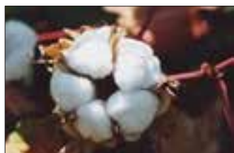
Fleur de coton