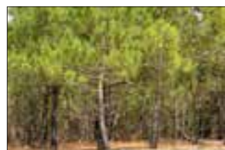
Pin des Landes