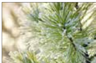
Cèdre du Liban