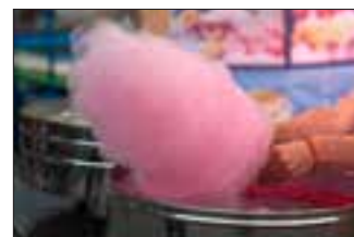
Barbe à papa